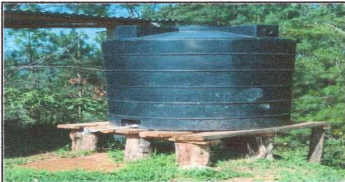
Foto 5: Vista lateral de espacio de recopilacion de agua en donde se puede evidenciar la necesidad de sustitucion de estructura de madera por metal.