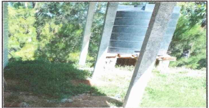
Foto 6: se observa la necesidad de la instalacion de techo con laminas troqueladas 10 pies para cubrir el tinaco de la cocina.

Observación: Si es necesario se pueden agregar hojas adicionales y actualizar el número de hojas.