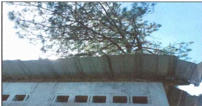
Foto 11: baño, Vista frontal de la sustitucion de costinera de madera en mal estado y la necesidad de instalacin de costanera de metal galvanizado..