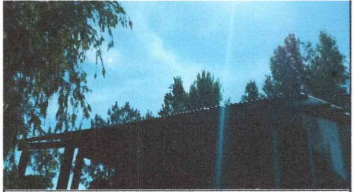
Foto 2: se observa la necesidad a la instalacion de canales troqueladas para la bajada de agua