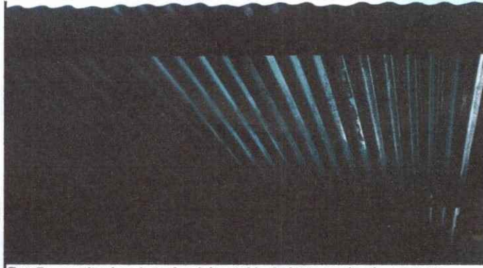
Foto7: sustitucion de techo del establecimiento en donde se puede observar la necesidad de instalacion de laminas troquelada.