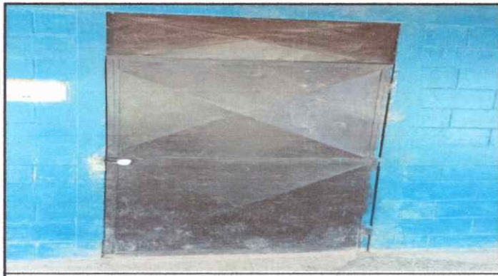
Foto 9: sustitucion de puetas oxidante en mal estado del establecimiento educativo.