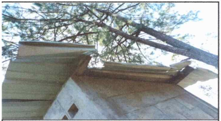
Foto 10: baño, Vista panoramica la sustitucion de laminas en mal estado y la necesidad de instalacion de laminas troquelada.