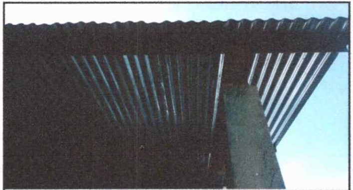
Foto 4: corredor, sustitucion de laminas en mal estado por laminas roquelada