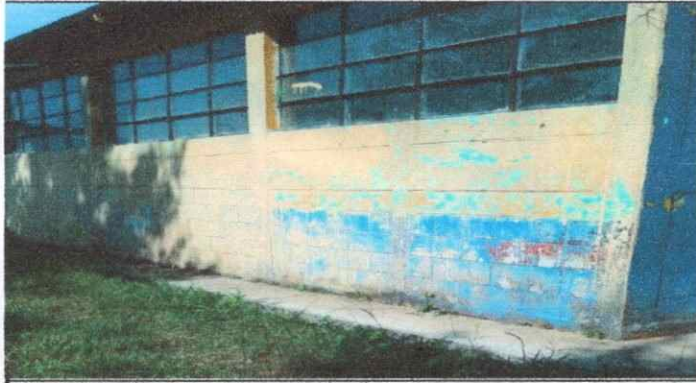
Foto1: Paredes del establecimiento en donde se puede percibir la necesidad de aplicación de pinturas en paredes, ya que hace tiempos no se ha dado mantenimiento.