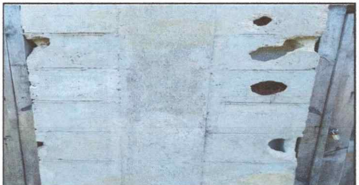
Foto 12: baño, se observa la necesida relleno y de la colocanion de repello.

Observación: Si es necesario se pueden agregar hojas adicionales y actualizar el número de hojas.