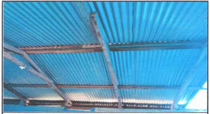
Foto 8: sustitucion de costinera de madera en mal estado por costinera de metal galvanizada del establecimiento.